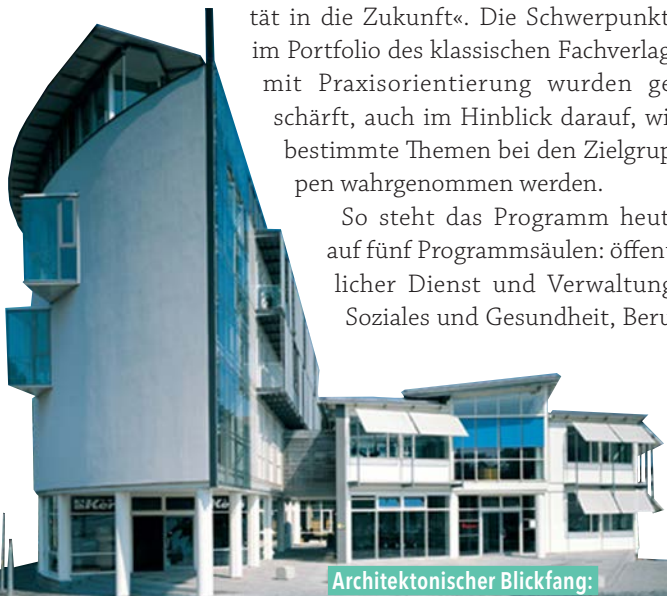
Architektonischer Blickfang: Stammsitz des Walhalla Fachverlags in Regensburg